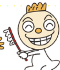
ハハハのハーちゃん