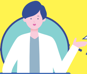
かかりつけ歯科医