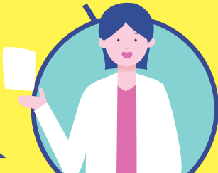
かかりつけ薬剤師